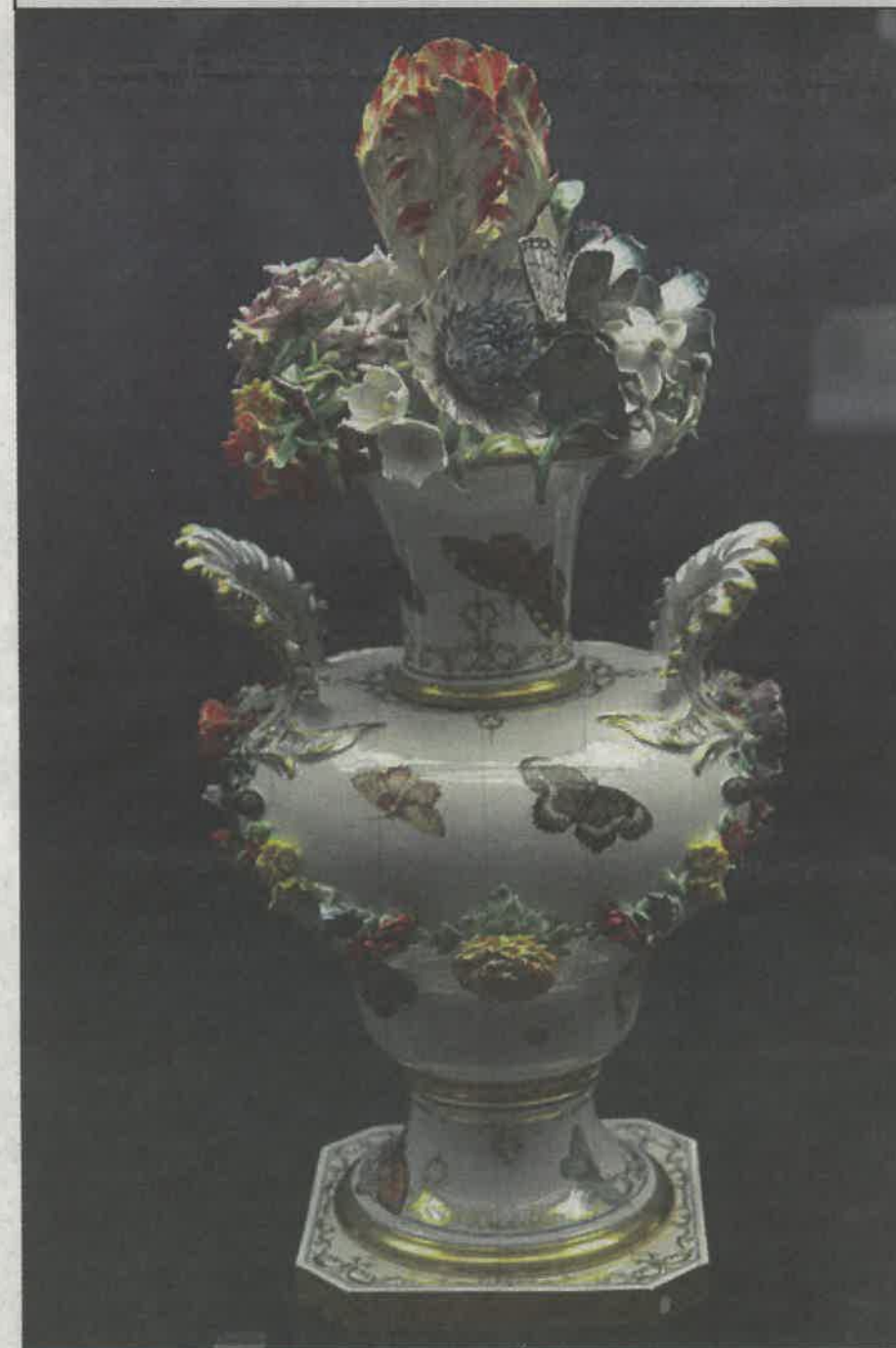
Ein porselensvase fra 1760 og 1765, på Marstallmuseet i Nymphenburg, München i Tyskland