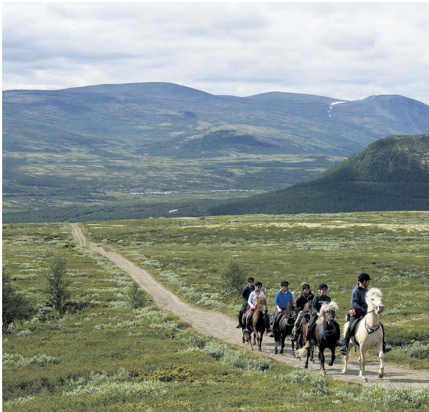
Utsyn: Ryttere langs den gamle kongeveien over Hjerkinnhøe er ett av mange fotografier i den nye boka om Dovrefjell.