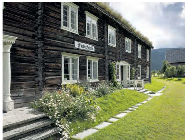
Fjellstuene: Forfatterne forteller historien om alle fjellstuene på Dovrefjell. Drivstua fjellstue er én av dem.